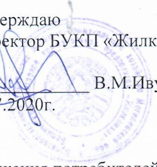
График отключения горячего водоснабжения потребителей