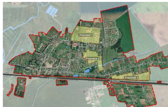
СХЕМА РАЗМЕЩЕНИЯ В СТРУКТУРЕ НАСЕЛЕННОГО ПУНКТА

Экспликация объектов в границах проектирования.