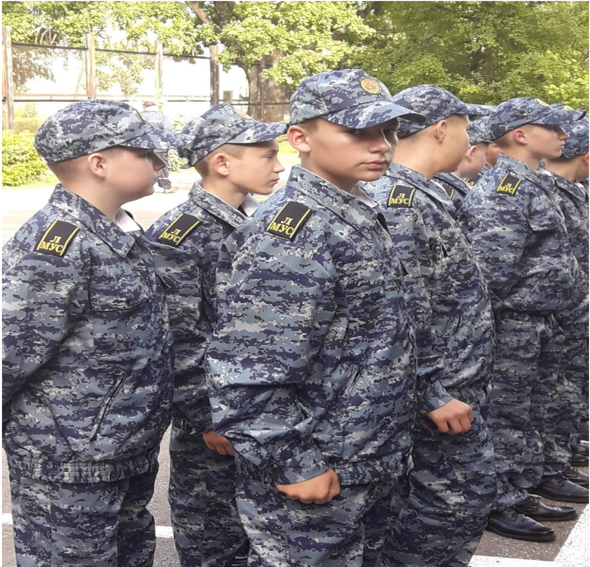
Отдых также распланирован.